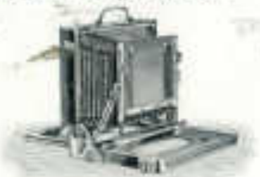
Fig. 5. Dimensionen: 12x18 cm, 24x36 cm.