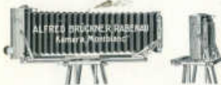
Fig. 12 Hauptmaß 21 1/2 x 12 1/2 x 4 cm