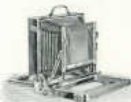
Fig. 11 Hauptmaß 21 1/2 x 12 1/2 x 4 cm

mit Platte 12x18 cm mit deutscher Ausrüstung